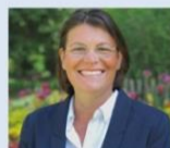
Mme Aude LUQUET

Député de la 2 nd e circonscription de Guadeloupe | Président du groupe parlementaire d'amitié France Bénin Rapporteur sur les crédits de la mission Outre-mer